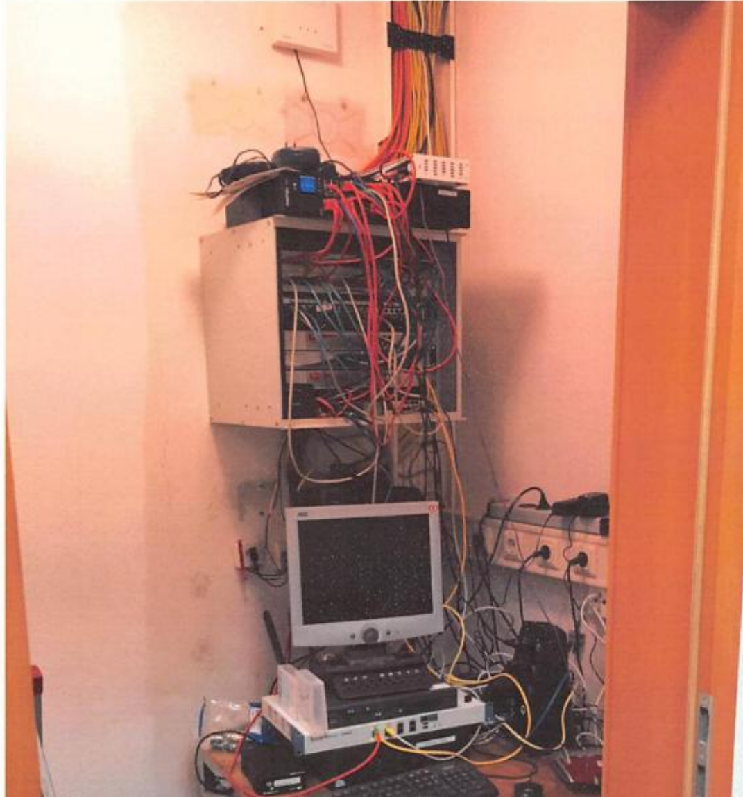
Beispiel - IST